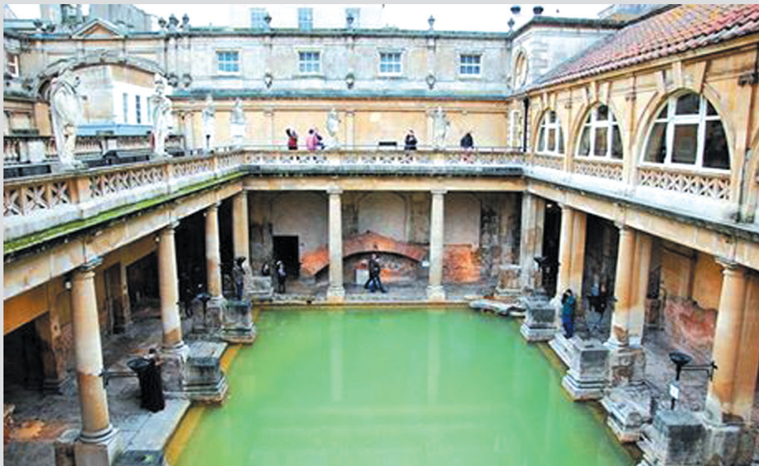
Roman Bath หรือ โรงอาบน้ำร้อนในสมัยโรมัน สิ่งก่อสร้างสำคัญทางประวัติศาสตร์ ซึ่งมีอายุกว่า 2,000 ปี ที่ยังคงสภาพความสวยและความสง่างาม ในรูปแบบจอร์เจียน และวิกตอเรียน (Georgian and Victorian)

Roman Bath แสดงรูปแบบและลักษณะทางศิลปกรรมของยุคสมัย ผ่านทางสถาปัตยกรรม และสิ่งก่อสร้าง ที่สะท้อนภูมิลักษณะของเมืองที่เป็นเมืองที่เป็นแหล่งน้ำพุร้อนธรรมชาติ ความคิด ความเชื่อ และวิถีชีวิตของผู้คนในยุคหนึ่ง ๆ ที่มีวัฒนธรรม “Thermae Bath Spa” ซึ่ง Roman Bath ได้รับการก่อสร้างขึ้นโดยชาวโรมันในคราวที่ยกพลขึ้นเกาะอังกฤษในปี ค.ศ. 60 ต่อมา สถานที่แห่งนี้ได้ถูกชาวโรมันทิ้งร้างไว้ จวบจนศตวรรษที่ 12 อังกฤษจึงได้มีการปรับปรุง Roman Bath ขึ้น โดยในการปรับปรุงนั้น มุ่งเน้นการแก้ไขตัวอาคารให้มีความแข็งแรงและคงทนด้วยวัสดุสมัยใหม่ หากแต่ยังให้คงรูปแบบและลักษณะของสถาปัตยกรรมในรูปแบบดั้งเดิมไว้ ส่งผลให้ Roman Bath ในปัจจุบันจึงยังคงให้ภาพและความรู้สึกเหมือนยังคงอยู่ใน Roman Bath ในยุคก่อสร้าง ปัจจุบัน Roman Bath เปิดเป็นพิพิธภัณฑ์ให้คนทั่วไปและนักท่องเที่ยวสามารถเข้าเยี่ยมชมได้