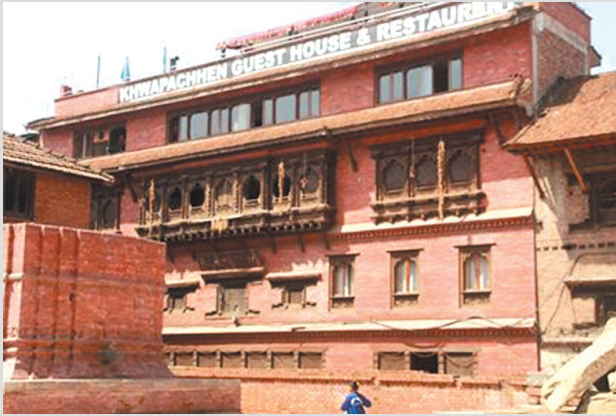
อาคารเก่าถูกดัดแปลงเพื่อรองรับนักท่องเที่ยว ในเชิงพาณิชย์กรรม