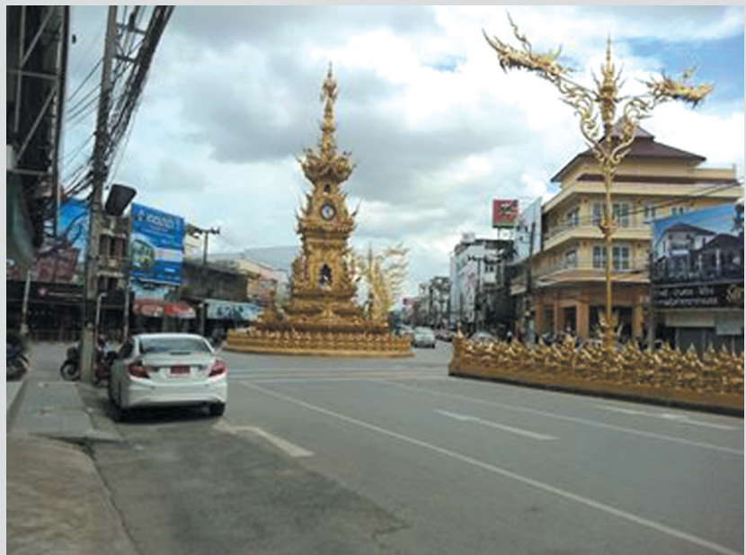
แลนด์มาร์ค (landmark) แสดงอัตลักษณ์ของเมืองเชียงราย ออกแบบโดยอาจารย์เฉลิมชัย โฆษิตพิพัฒน์