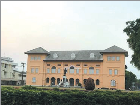
การปรับศาลากลางจังหวัดหลังเก่า ให้เป็นพื้นที่ช่วงวัฒนธรรม โดยตัวอาคารบูรณะเป็นพิพิธภัณฑ์เชียงราย

จากความเป็นอัตลักษณ์ของเมืองที่ส่งผลให้การพัฒนาเมืองเชื่อมโยงกับการท่องเที่ยวได้ในกรณีดังกล่าว เทศบาลนครเชียงรายและองค์การบริหารส่วนจังหวัดเชียงราย จึงได้ริเริ่มโครงการการฟื้นฟูเมือง (Urban Renewal) การอนุรักษ์พื้นที่ที่มีความหมายและความสำคัญทางประวัติศาสตร์ของเมืองเชียงราย และการฟื้นฟูสถาปัตยกรรมล้านนาในย่านเมืองเก่าของเมืองเชียงราย เช่น อาคารเก่าในเขตเมือง และกลุ่มอาคารในพื้นที่ศาลากลางหลังเก่า เพื่อคงไว้ซึ่งคุณค่าและความหมายของความเป็นมาและรากเหง้าของชุมชน โดยเป็นการฟื้นฟูสถาปัตยกรรมเก่าและการพัฒนาเมืองให้มีความสวยงาม พร้อมทั้งสามารถตอบสนองความต้องการของผู้ใช้สอยมากยิ่งขึ้น ทั้งนี้ ในการดำเนินการได้สร้างความร่วมมือระหว่างภาครัฐ ภาคเอกชน และภาคประชาชน เพื่อความยั่งยืนของเมืองและสุขภาวะของผู้คนที่อยู่อาศัยในเมือง โครงการในการพัฒนาเมือง เพื่อการอนุรักษ์สภาพทางภูมิทัศน์วัฒนธรรม และเป็นแนวทางในการอนุรักษ์