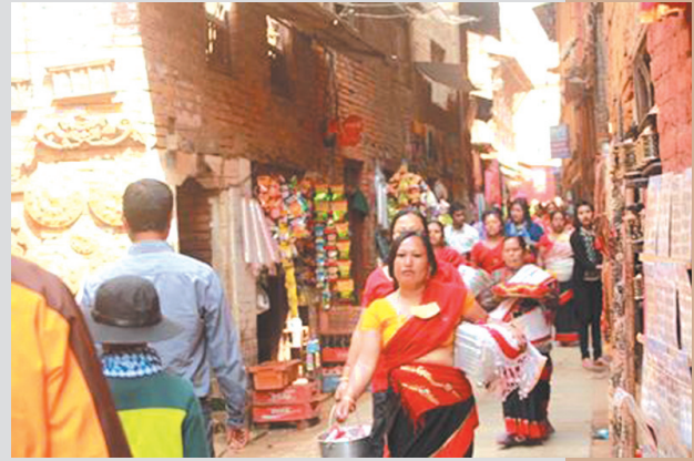
ชาวเนปาลยังคงดำเนินวิถีชีวิตปกติ ภัตตาคารจึงเสมือน “พิพิธภัณฑ์ที่มีชีวิต” สร้างคุณค่าอัตลักษณ์เมืองที่เด่นชัดทางวัฒนธรรม

นอกจากนั้น การวางผังเมืองของภัตตาคารซึ่งผูกพันกับความเชื่อของชาวเมือง โดยการ จัดวางผังรูปหอยสังข์ซึ่งเป็นอาวุธประจำกายของพระวิษณุ (Vishnu) แกนของสังข์เป็นถนนสายหลัก ของเมืองที่เชื่อมจัตุรัสดูร์บาร์และจัตุรัสภัตตาคาร ถนนสายเล็ก ๆ เชื่อมระหว่างถนนสายหลัก ของเมือง จะเป็นที่ตั้งของพระราชวัง และศาสนสถานต่าง ๆ ในปัจจุบัน การใช้ประโยชน์ที่ดิน ในพื้นที่โบราณสถาน ยังมีการวางแผนการใช้ประโยชน์พื้นที่อย่างสอดคล้องและเหมาะสม นักท่องเที่ยวสามารถพักในเขตโบราณสถานและเลือกซื้อสินค้าพื้นเมืองในราคาถูกที่เกิดจาก ผลผลิตของชุมชน และเรียนรู้วัฒนธรรมและวิถีชีวิตของชุมชนอย่างแท้จริง ทำให้สามารถสร้าง รายได้ให้แก่คนท้องถิ่นได้โดยตรง