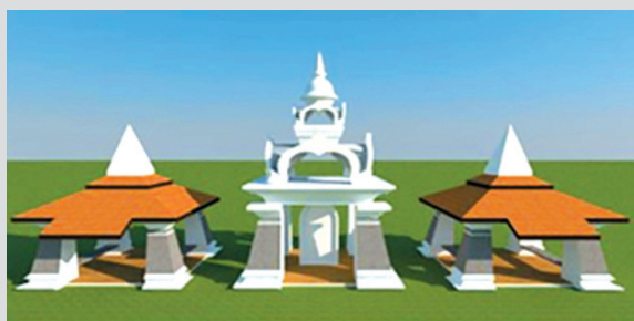
การกำหนดรูปแบบสถาปัตยกรรมที่เหมาะสม ในเขตพื้นที่เมืองประวัติศาสตร์เชียงแสน