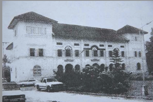
ศาลากลางในอดีต