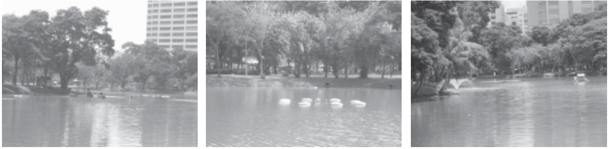
บริเวณที่มีการติดตั้งเครื่องเติมอากาศและน้ำพุ