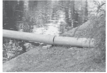
สภาพบ่อดักไขมันและท่อรวบรวมน้ำเสีย