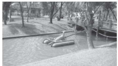
เครื่องผลักดันน้ำ

มีการดำเนินการสำรวจ ขุดลอกตะกอน ล้างทำความสะอาดตะกอนภายในเส้นท่อและซ่อมแซมท่อลอดถนนภายในสวนลุมพินี เพื่อไม่ให้ท่อเกิดการขังหรืออุดตัน และให้น้ำในสระของสวนลุมพินีเกิดการไหลเวียน ในกรณีพื้นที่ที่มีระดับสูงการไหลเวียนน้ำทำได้ยาก มีการดำเนินการติดตั้งเครื่องผลักดันน้ำตามท่อลอดถนนแต่ละจุดโดยรอบทั้งสวนลุมพินี