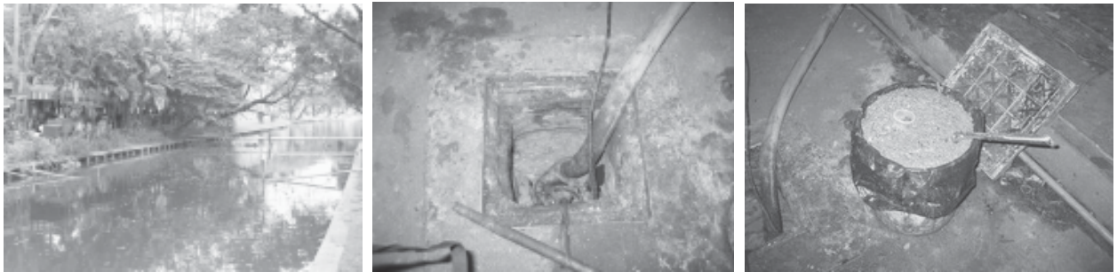
การปรับปรุงที่รวบรวมน้ำเสียและการทำความสะอาดบ่อดักไขมัน

จากดำเนินการตรวจสอบสภาพที่รวบรวมน้ำเสียจากสถานที่จำหน่ายอาหารพบว่า มีน้ำรั่วบริเวณข้อต่อและการวางท่อไม่ได้ระดับ สำหรับบ่อดักไขมันพบว่าไม่มีการตกหรือทำความสะอาดเป็นประจำทุกวันทำให้เกิดการอุดตันดังนั้นเพื่อให้การรวบรวมน้ำเสียของสถานที่จำหน่ายอาหารไปบำบัดที่โรงควบคุมคุณภาพน้ำดินแดงของกรุงเทพมหานคร เป็นไปอย่างมีประสิทธิภาพ ได้ทำการซ่อมแซมที่รวบรวมน้ำเสียบริเวณข้อต่อและการวางแนวท่อให้ได้ระดับ รวมทั้งสูบล้างทำความสะอาดบ่อดักไขมันของสถานที่จำหน่ายอาหารให้อยู่ในสภาพใ้การใช้การได้ตลอดเวลา