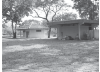
ท่อน้ำเสียจากห้องน้ำ-ห้องส้วมสาธารณะ แหล่งกำเนิดน้ำเสียและสภาพน้ำภายในสวนลุมพินี