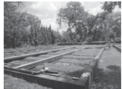
ระบบบำบัดน้ำเสียแบบการใช้พืชน้ำ