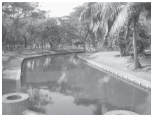
สระน้ำในปัจจุบันของสวนลุมพินี