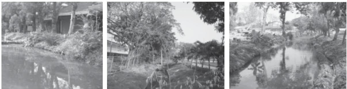
การย้ายและการปรับปรุงพื้นที่บริเวณศูนย์ฝึกอาชีพของกรุงเทพมหานคร

เนื่องจากศูนย์ฝึกอาชีพของกรุงเทพมหานครมีน้ำเสียจากการการเรียน ตัดผมและการประกอบอาหารดังนั้นเพื่อไม่ให้มีน้ำเสียจากศูนย์ฝึกอาชีพของกรุงเทพมหานครระบายลงสู่คูน้ำของสวนลุมพินีโดยตรง กรุงเทพมหานคร ได้มีการดำเนินการปรับปรุงเรือนเพาะชำให้เป็นศูนย์ฝึกอาชีพฯ แห่งใหม่ และมีการติดตั้งระบบบำบัดน้ำเสียแบบสำเร็จรูปเพื่อบำบัดน้ำเสียให้ได้มาตรฐานก่อนปล่อยลงสู่คูน้ำ