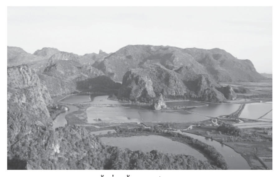
พื้นที่ชุ่มน้ำเขาสามร้อยยอด