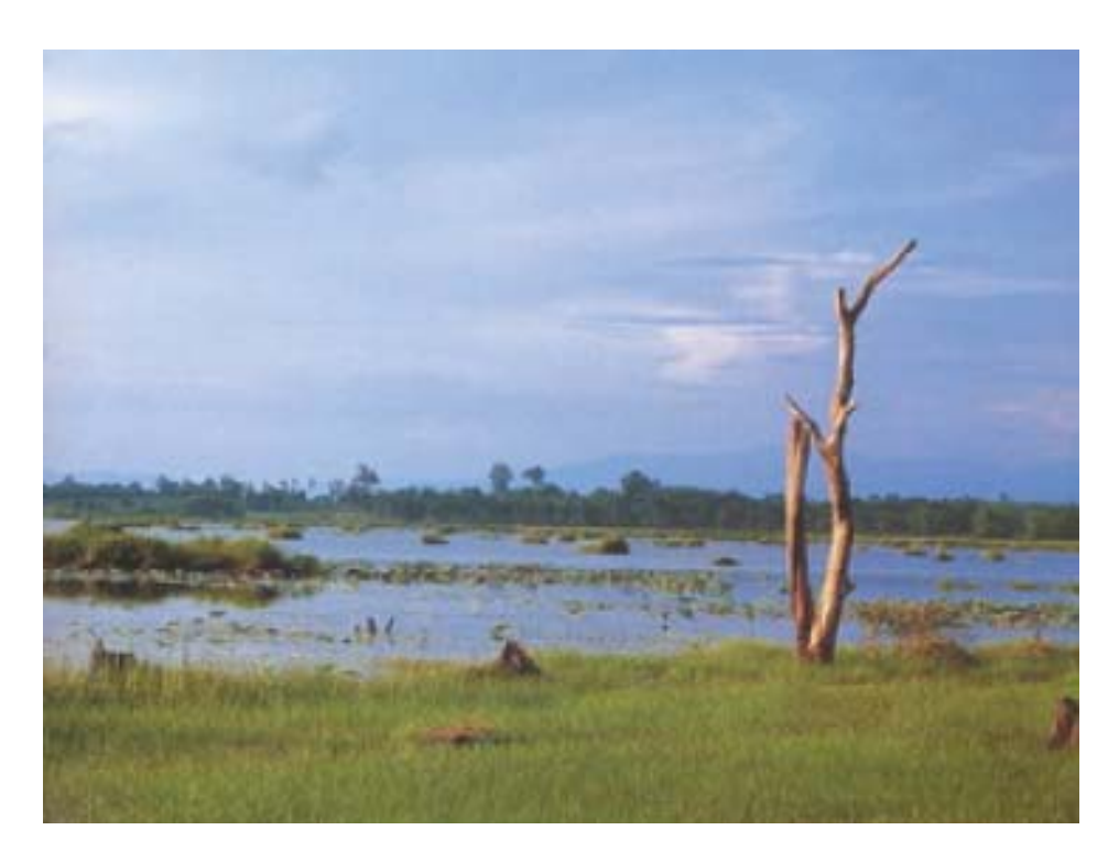
พื้นที่ชุมน้ำบึงโขงหลวง