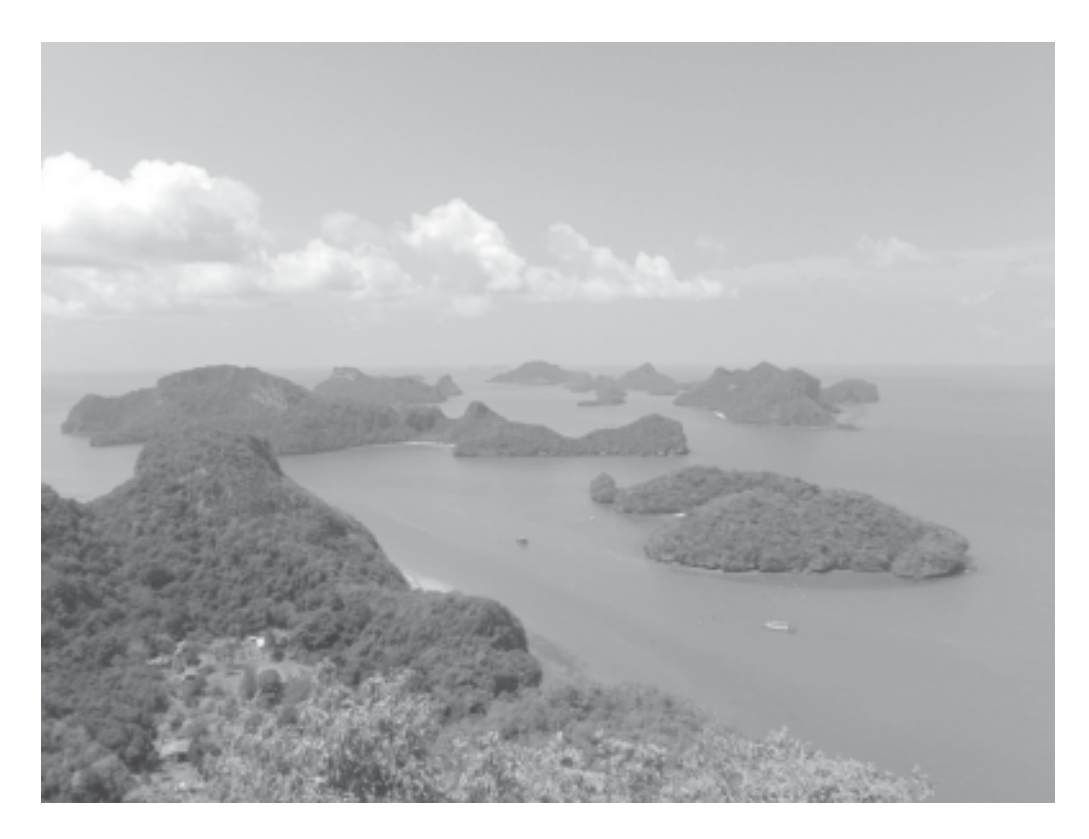
พื้นที่ชุ่มน้ำหมู่เกาะอ่างทอง