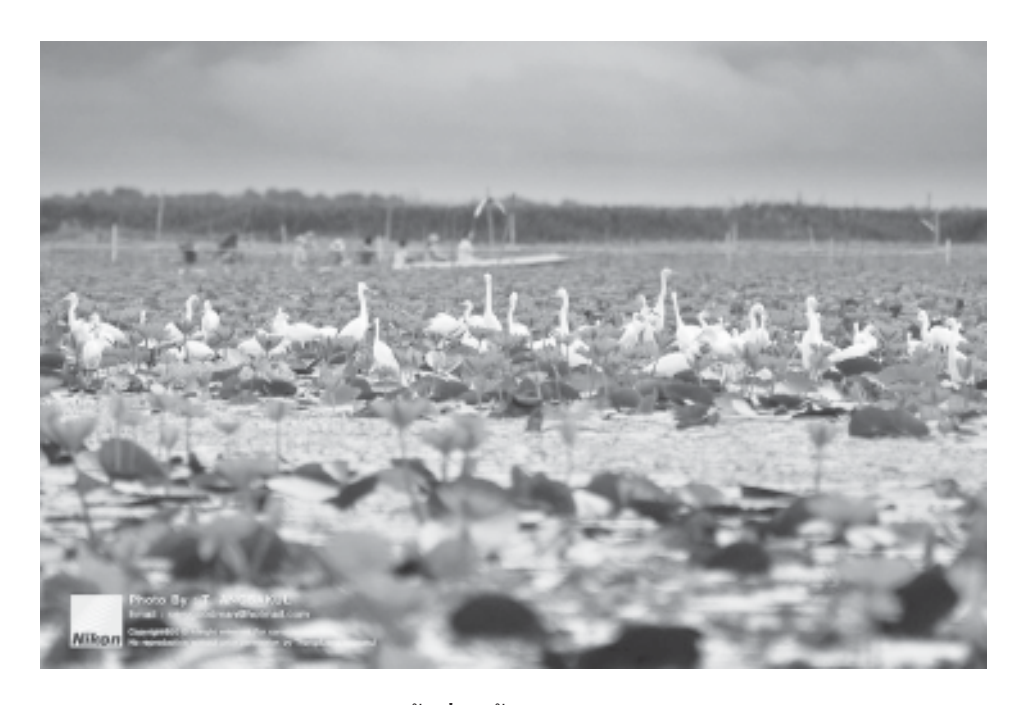
พื้นที่ชุมน้ำทะเลน้อย