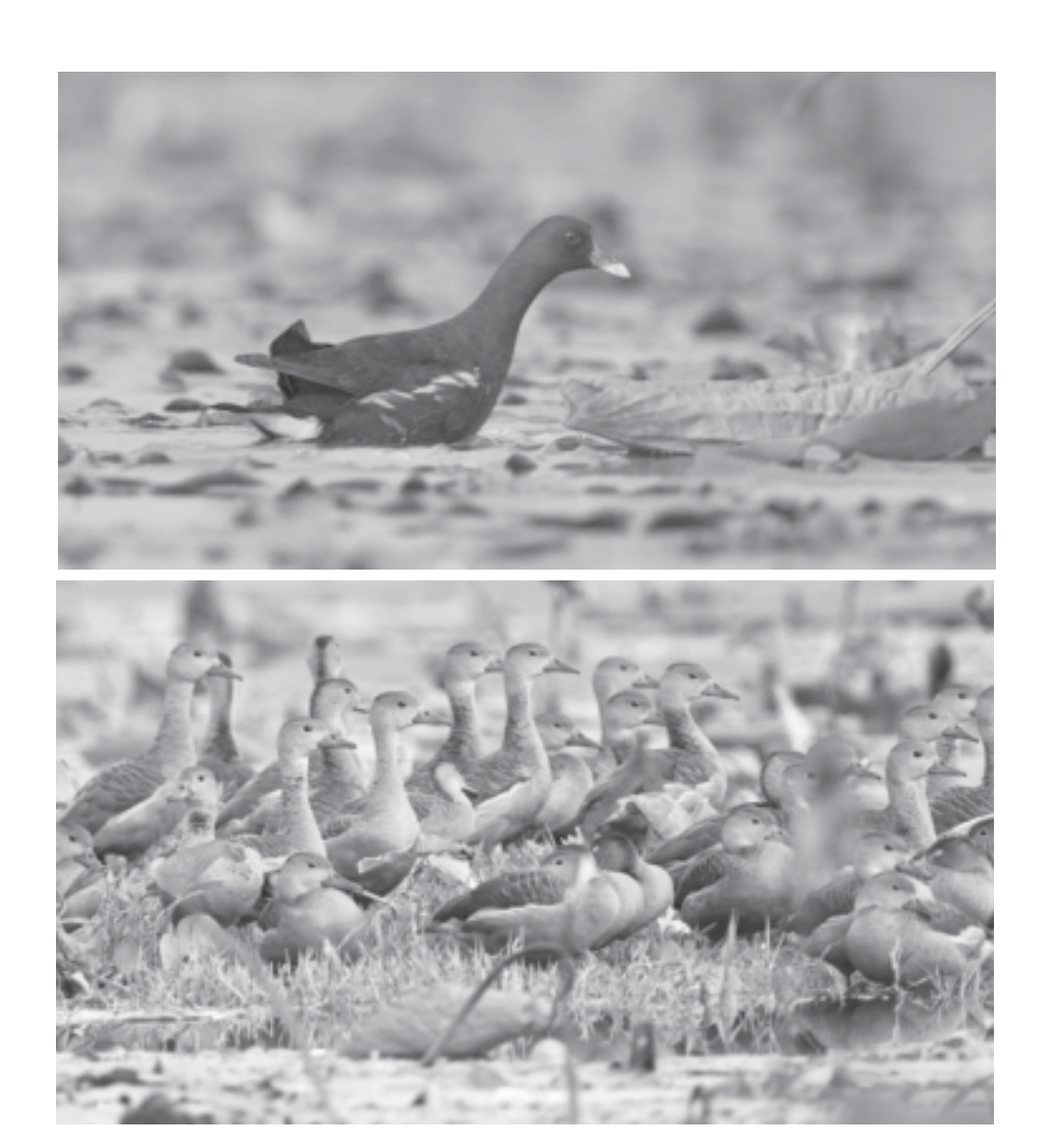
พื้นที่ชุมน้ำหนองบงคาย

4. เสริมสร้างจิตสำนึกและตระหนักในความสำคัญของพื้นที่ชุ่มน้ำ ด้วยการจัดงานรณรงค์วันพื้นที่ชุ่มน้ำ วันที่ 2 กุมภาพันธ์ของทุกปี โดยในปี พ.ศ. 2555 ใช้หัวข้อรณรงค์ว่า Wetland and Tourism