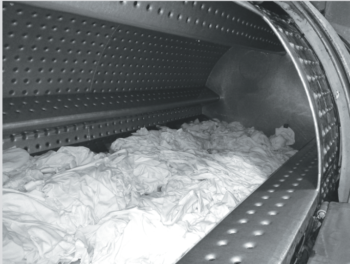
การนำเสื้อขาวลงย้อมด้วยสีคาร์บอกซีในเครื่องย้อมชนิด Garment piece dyeing โดยขั้นตอนนี้จะเริ่มใส่สีย้อมละลายน้ำลงไปก่อน ซึ่งตัวสียังไม่สามารถจะติดบนผ้าได้จนกระทั่งเติมเกลือโซเดียมคลอไรด์เพื่อเพิ่มการดูดซึม และเติมค่าโซเดียมคาร์บอเนตเป็นตัวเร่งปฏิกิริยาให้สีย้อมทำปฏิกิริยากับผ้าฝ้าย

ลูโลส และเส้นใยขนสัตว์ได้ การย้อมสีกลุ่มนี้จำเป็นต้องเติมเกลือในปริมาณสูงมากที่สุดเมื่อเทียบกับสีย้อมชนิดอื่น ซึ่งในกรณีที่เป็นสีเข้มมากๆ นั้นอาจจะต้องใช้เกลือ ถึง 60-80 กรัม/ลิตรทีเดียว และนอกจากนั้นถ้าสีรีแอคทีฟนั้นนำมาใช้ย้อมบนเส้นใยฝ้ายหรือเส้นใยเซลลูโลสอื่นๆ ก็จำเป็นต้องใช้ต่างอย่างโซดาแอช และโซดาไฟช่วยในการเร่งทำให้สีเกิดปฏิกิริยากับเซลลูโลสในเส้นใยอีกด้วย แต่เมื่อทำการย้อมเสร็จจำเป็นต้องทำการกำจัดสีส่วนเกินออกด้วยน้ำจำนวนมาก และสารช่วยละลายสีส่วนเกินให้ออกมาจนหมดด้วยเพื่อป้องกันสีตก สีย้อมประเภทนี้สามารถทำปฏิกิริยากับเส้นใยเกิดเป็นพันธะโควาเลนต์ (Covalent bond) ทำให้มีความคงทนต่อการซักที่สูงมาก