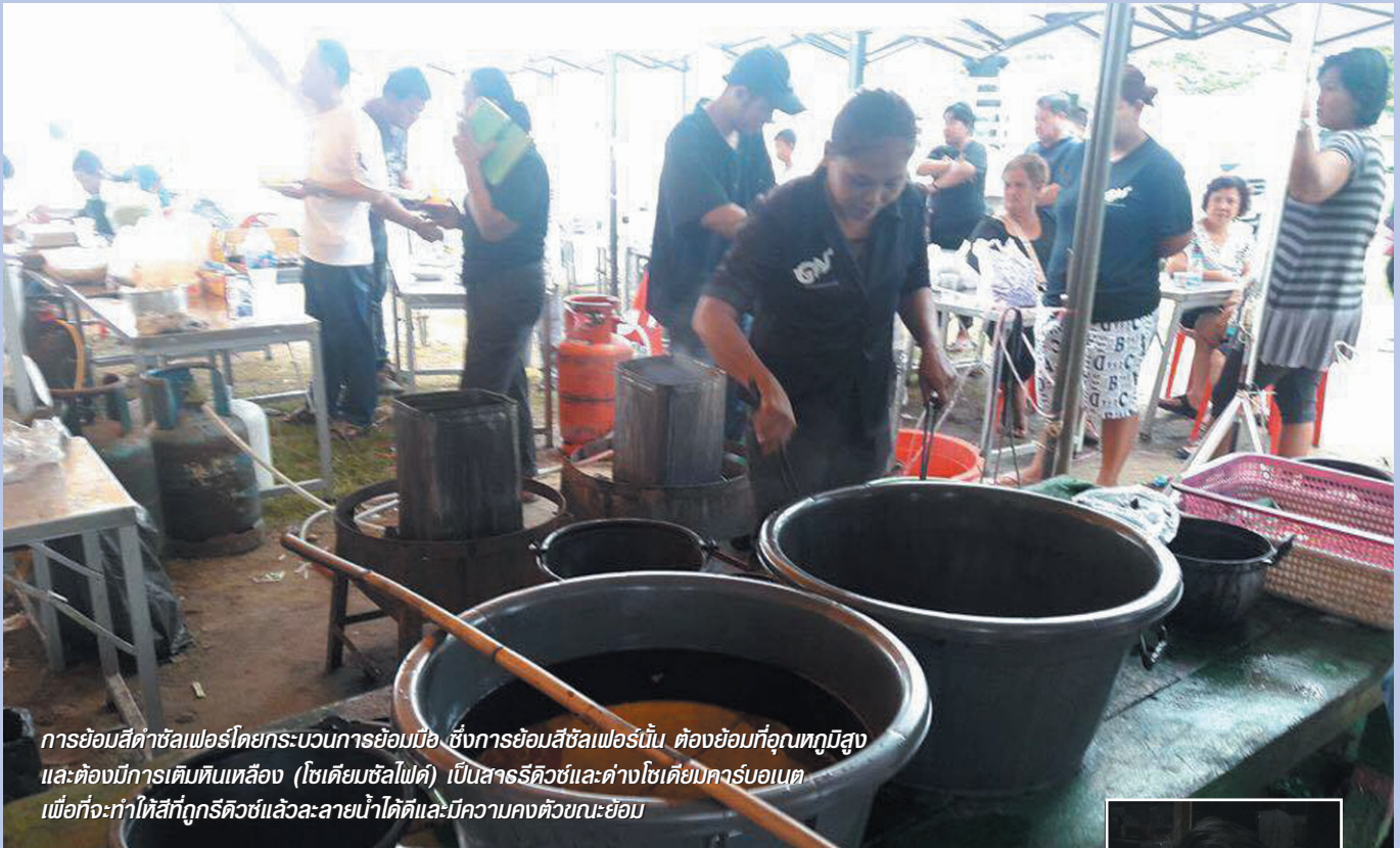
การย้อมสีผ้าซัลเฟอร์โดยกระบวนการย้อมมือ ซึ่งการย้อมสีซัลเฟอร์นั้น ต้องย้อมที่อุณหภูมิสูง และต้องมีการเติมหินเหลือง (โซเดียมซัลไฟด์) เป็นสารรีดิวซ์และล้างโซเดียมคาร์บอเนต เพื่อจะทำให้สีที่ถูกรีดิวซ์แล้วละลายน้ำได้ดีและมีความคงตัวขณะย้อม