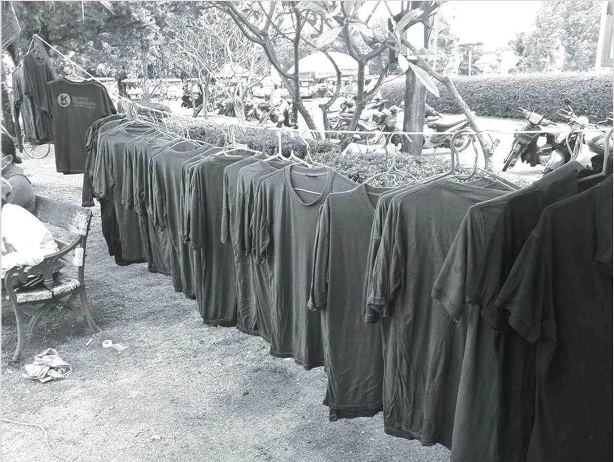
เสื้อผ้าหลังจากการย้อมด้วยสีซิลเฟอร์แล้วนำมาผึ่งลมเพื่อออกซิไดซ์กับออกซิเจนในอากาศ เพื่อที่จะทำให้สีย้อมนั้น กลับคืนอยู่ในรูปที่ไม่ละลายน้ำและมีความคงทนต่อการซักที่ดีก่อนที่จะส่งคืนประชาชนนำไปซักและสวมใส่ต่อ

ช่วยในการย้อมสี (Textile auxiliaries) และเครื่องจักรที่ใช้ในการย้อมสี (Dyeing machine) ซึ่งเป็นเรื่องที่ค่อนข้างยากพอสมควร เนื่องจากว่ามีข้อจำกัดทางด้านสิ่งแวดล้อมต่างๆ ที่เพิ่มขึ้นตลอดเวลา